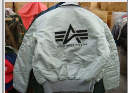
Bomber CWU45-R Made in USA